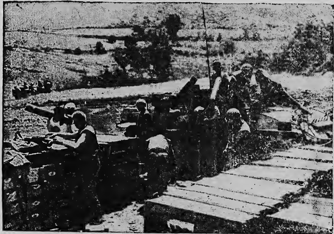
De grote moeilijkheid voor de geallieerden om de vijandelijke aanval tot staan te brengen zijn de dikke modderlagen die de wegen in dit seizoen bedekken. De Noordelijken hebben hier minder last van omdat hun leger minder modern en minder gemechaniseerd is. De fanatieke communisten excelleren als bajonetvechters en profiteren van de weersomstandigheden om dit voordeel uit te buiten. De normale trucks kunnen niet door de modder. Alle transporten moeten plaats vinden op voertuigen met rupsbanden.

WENEN. — De burgemeester van West-Berlijn, prof. Ernst Reuter, die momenteel in Wenen het internationale steucongres bijwoont, heeft de demonstraties in Oost-Berlijn een revolutie genoemd tegen de ontbering en onderdrukking, die het Sovjet-bewind over het volk heeft gestort. Prof. Reuter wees in een interview met D. P. A. het denkbeeld van de hand, dat de demonstraties zouden zijn op touw gezet door de communisten zelf. De spanning in Oost-Berlijn en Oost-Duitsland nam de afgelopen maanden gestadig toe. Het volk van Oost-Berlijn was niet hermetisch van het Westen afgesloten en kon daardoor vergelijkin-